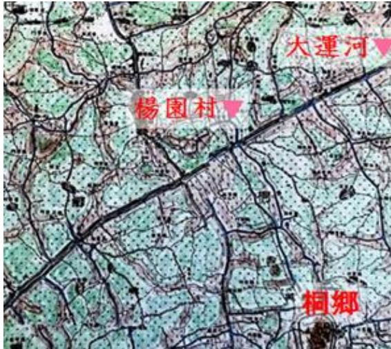
図 25 桐郷楊園村周辺の圩田