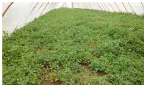
図6：ビニールハウス栽培の苜蓿

『農言』では、牛や馬の飼料として苜蓿の栽培や収穫法が述べられ、飼料用には葉の部分だけでなく根も利用している。農民によると、今でも苜蓿が小さく茎が柔らかいころは食用にし、大きくなったら飼料用にするとのことであった。原上では、ビニールハウスで栽培しているところを見ることができた [図6]。