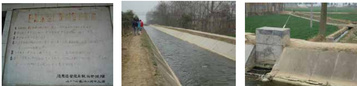
図5：涇惠渠とその周辺の麦畑

調査のために原上の麦畑を歩いていると、畑の用水路は水を流さない時期らしく乾いており、またあぜ道はひび割れしている所もあった。ただ現在では涇惠渠からポンプで原上まで汲み上げ灌漑しているため、畑の端の土を少し掘るとしっとり湿っており、麦の葉色も青かった。平川をさらに南下すると豊かな水量の涇惠渠があり、周囲の畑（麦・スイカ）に水を巡り渡らせていた。