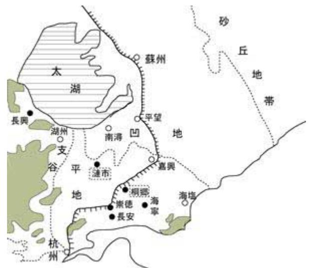
図 24 太湖デルタの地形区分

最初に地勢を見ておこう。参考図 24 は地勢を確認するために、かつて高谷好一が作成した地図(25)に、本稿の関連する地名を書きこんだものである。高谷が指摘した、支谷・平地・凹地の地勢区分上に地名を落としてみた。すると桐郷など関連地域のほとんどが「平地」に位置していた。ここは「凹地」地域ほど低地ではなく、水害の影響がそれほど大きくはなかったとみられる。次に、参考図 25 は民国 3 (1914)年作成の 5 万分の 1 地図を使って主な土地利用ごとに色分けしたものである。これを見ると水路の両側に桑畑があり、それが水田を取り囲んでいた。堤防で囲まれた圩田そのものの形状である。これは先に見た現地調査の結果とほぼ同じであり、この百年ほど基本的形状は変わっていなかった。『補農書』が書かれた明末は、圩田の再編も済んでおり(26)、基本はほぼ同じだったのではないだろうか。