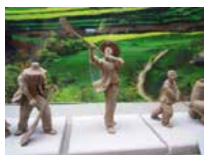
図 14：風選用のスコップと、風選をしている様子（左：永合村、右：農業博物館）