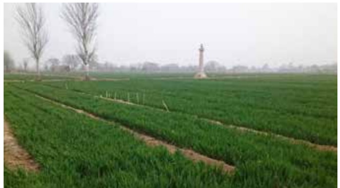
図 4：原上の麦畑 (中央の柱は、献陵への墓道入口に建てられた華表。現在は周囲に麦畑が広がっている)

『農言』には、主穀として「麦」(コムギ)と「穀」(アワ)の栽培が述べられている。特に麦の記述が多く、当地では麦栽培を中心としていたことが読み取れる。今回、調査に入ったのが 3 月後半だったため、原上・平川にはまだ背の低い麦の畑が一面に広がり [図 4]、坡坨地と宅地周辺にはアブラナと野菜が栽培されていた。