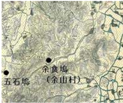
図18 余食場・五石塙 地図 (五万分一外邦図)