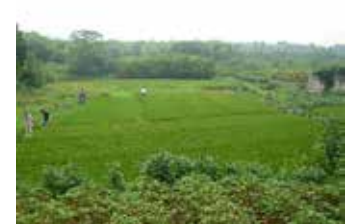
図17 下菰城城壁より城内を望む