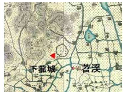
図16 下菰城周辺（民国三年測量外邦図）

排水に苦慮する太湖周辺低地に比して山麓部は水害を避けることが容易なため、水利技術が未発達な古代においては、ここに都市が建設され拠点となっていた。また湧き水や溪流を引水して、古くから安定した稲作農業が行われたと考えられる。下菰城周辺では、現在でも水稻作が行われている。1990年代には、日本の稲の品種を導入したところ、成長が早すぎて鳥に穂を食べられてしまい、うまくいかなかったという。