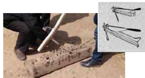
図 15 刃がなくなっているため棒で表現した。右上は、王禎『農書』農器図譜集之五

『農言』では、これら家畜の飼料を安く購うために、苜蓿は葉だけでなく根も飼料とし、麦のワラや、豌豆の蔓も、細かく刻み飼料にするなど、食用にならない部分を家畜用の飼料にしたとある。綿やタバコほどには現金収入となるような農作物が少ない中で、経営を持続するため必要に迫られてのことだろう。ちなみに草や麦ワラを切る際には鋤という農具を使っており、永合村内では木製の鋤を見ることができた [図 15]。