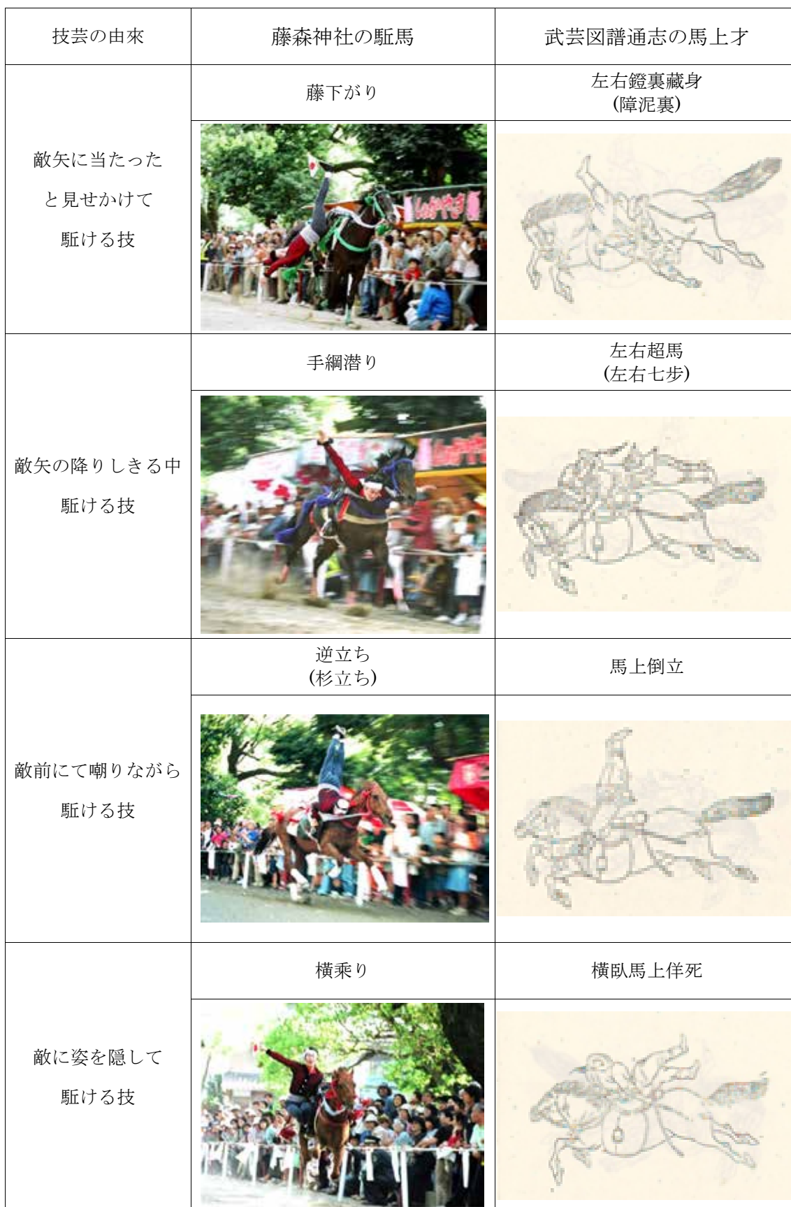
表 1 藤森神社の駈馬と武芸図譜通志の馬上才の技芸比較