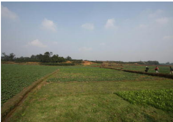
図2 鉄牛村遺跡遠景

この大型土坑の周囲には 7 基の略円形土坑が検出されている。それらのうちの一部分が大型土坑に切られていることから、円形土坑はそれよりも古いと考えられる。略円形土坑は