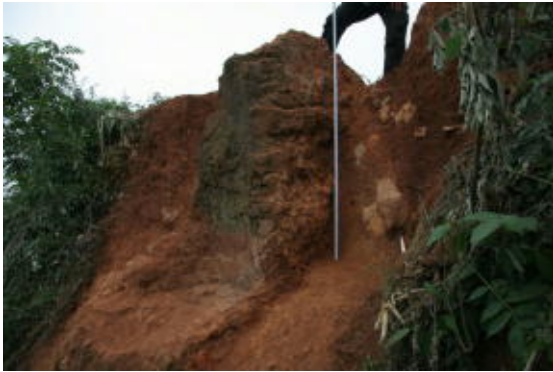
図8 製鉄炉(斜めから)