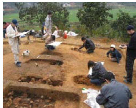
図5 鉄牛村遺跡調査風景