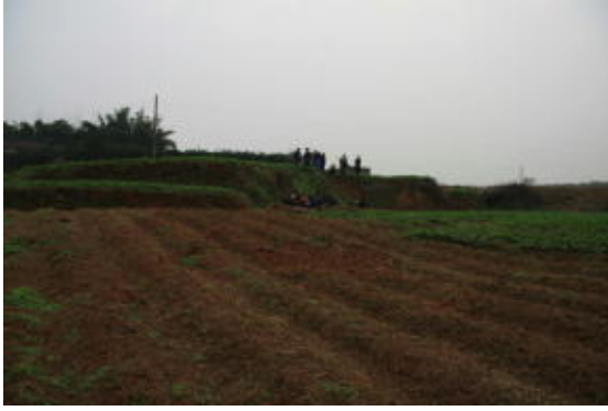
図6 古石山遺跡 C 地点近景