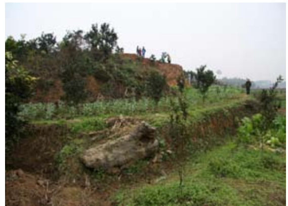
図3 大鉄塊「鉄牛」と丘陵調査区