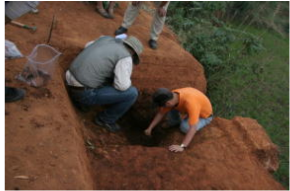
図9 製鉄炉後背部の調査風景

ることができ、緩傾斜面を一旦垂直にカットして、断面L字形に平坦面を造成し、そこに築炉されたことがわかった。